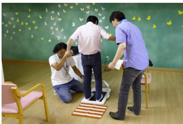
足型計測器を使用しての計測