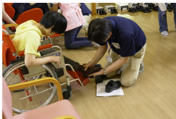
計測データをもとにフィッティングを実施